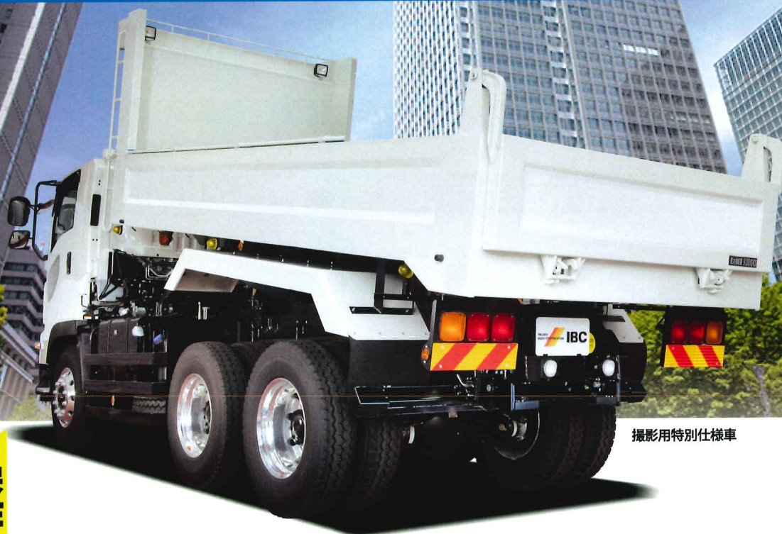
撮影用特別仕様車